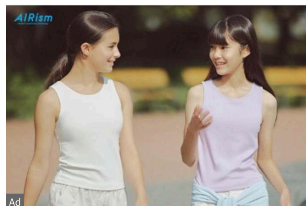
AIRISM pieces to keep your active kids cool and dry all day long UNIQLO