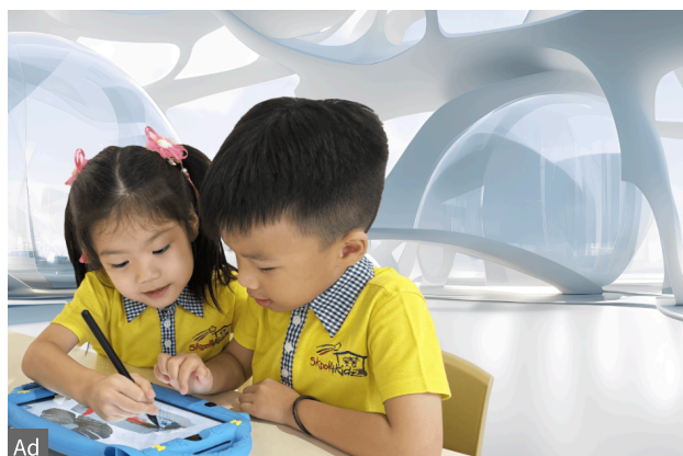
Future-Ready Preschool $200 welcome pack for enrolments at selected centres! Skool4Kidz Preschool