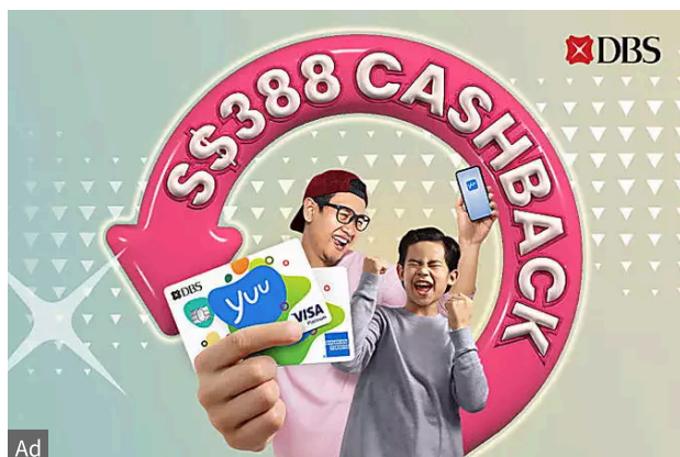
DBS yuu Card upsized to 18% cash rebates DBS Bank Ltd.